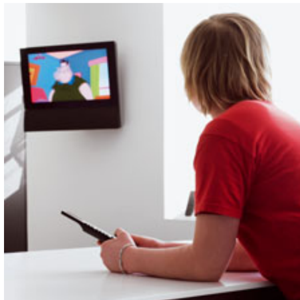
Tv i køkkenet er rart, så du ikke går glip af yndlingsprogrammet.

Husk også et telefonudtag og tænk over, om det vil være rart at kunne slutte pc'en til en netforbindelse i køkkenet, for eksempel hvis børnene gerne vil være sammen med jer andre uden at skulle undvære computeren.