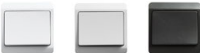
LK OPUS® 66. 66 mm bred. Hvid, lysegrå eller koksgrå.