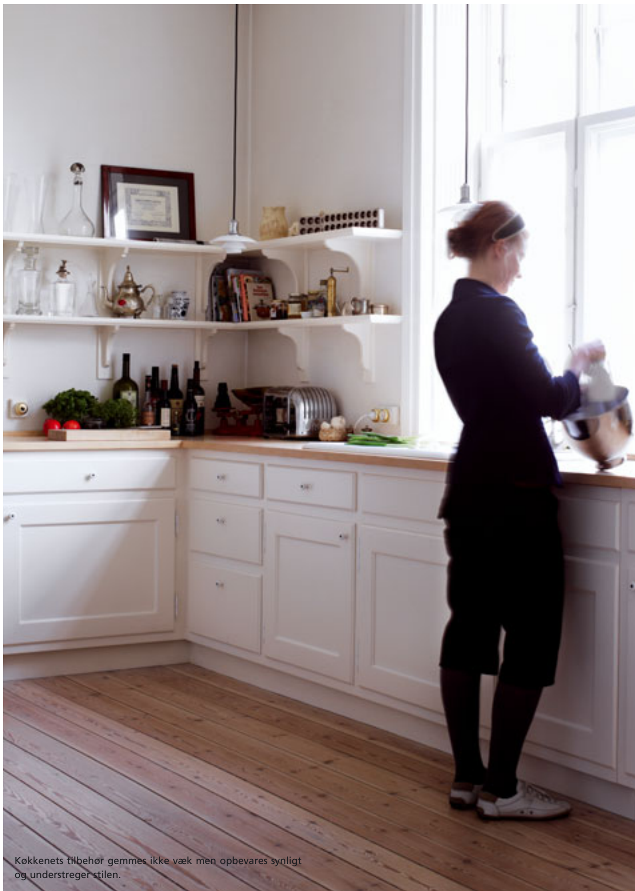
Køkkenets tilbehør gemmes ikke væk men opbevares synligt og understreger stilen.