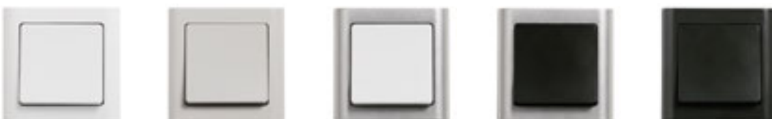
LK FUGA Softline®. 63 eller 68 mm bred. Hvid, lysegrå, hvid/stålm metallic, koksgrå/stålm metallic og koksgrå.