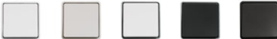
LK FUGA Baseline®. 50, 63 eller 68 mm bred. Hvid, lysegrå, hvid/stålm metallic, koksgrå/stålm metallic og koksgrå.