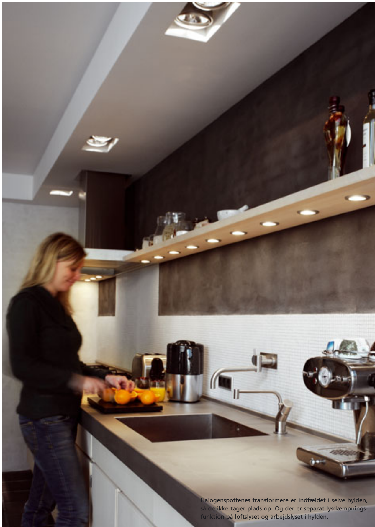
Halogenspottenes transformere er indfældet i selve hylden, så de ikke tager plads op. Og der er separat lydæmpningsfunktion på loftslyset og arbejdslyset i hylden.