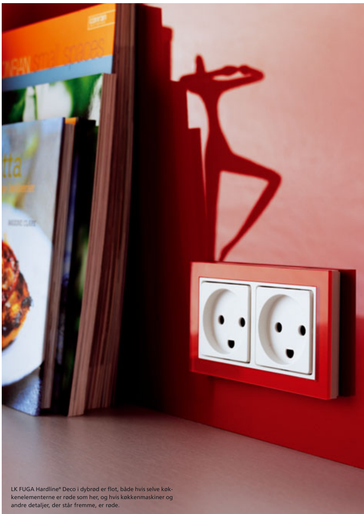
LK FUGA Hardline® Deco i dybrød er flot, både hvis selve køk- kenelementerne er røde som her, og hvis køkkenmaskiner og andre detaljer, der står fremme, er røde.