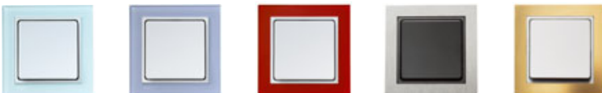
LK FUGA Hardline® Deco. 68 mm bred. 2,5 mm tyk front i glasklar, pastelblå eller dybrød akryl samt børstet stål og poleret messing.