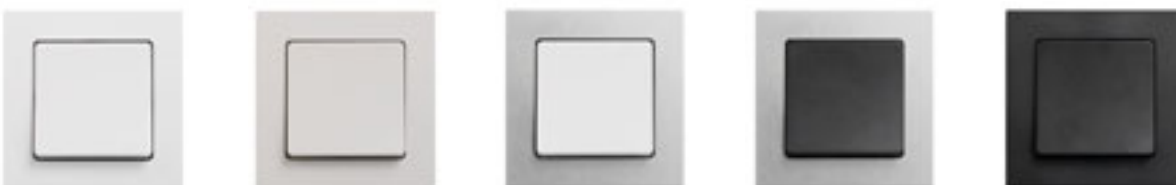
LK FUGA Hardline®. 68 mm bred. Hvid, lysegrå, hvid/stålm metallic, koksgrå/stålm metallic og koksgrå.