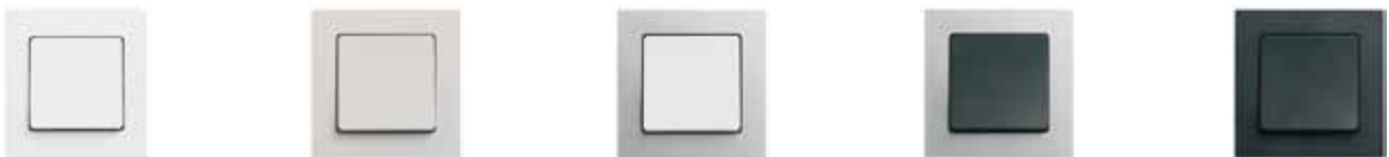
LK FUGA Hardline® . 68 mm bred. Hvid, lysegrå, hvid/stålm metallic, koksgrå/stålm metallic og koksgrå.