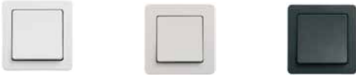
LK FUGA Baseline® . 63 mm bred. Hvid, lysegrå og koksgrå.