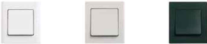
LK FUGA Baseline® . 68 mm bred. Hvid, lysegrå og koksgrå.