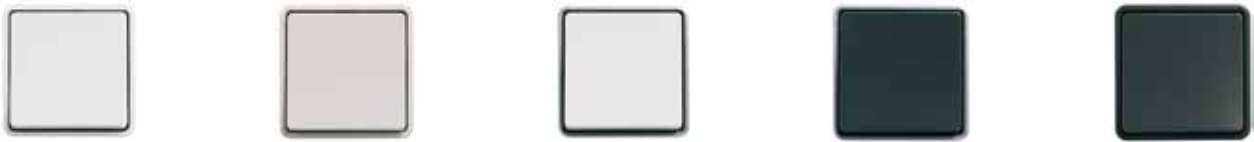
LK FUGA Baseline®