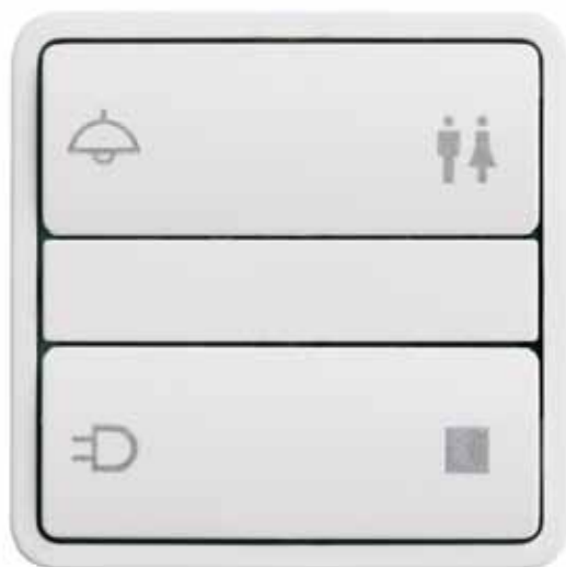
◀ LK FUGA® betjeningstryk i hvid med 50 mm Baseline ramme.

Ønsker du at vide mere om IHC, kan du rekvirere separate brochurer via www.lk.dk .