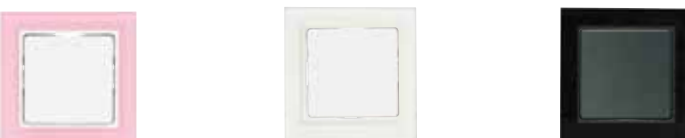
LK FUGA Hardline® Deco . 68 mm bred, 2,5 mm tyk front i glasklar, pastelblå, lyserød, dybrød, sort, hvid samt børstet stål og poleret messing