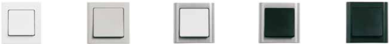
LK FUGA Softline® . 63 mm bred. Hvid, lysegrå, hvid/stålm metallic, koksgrå/stålm metallic og koksgrå.