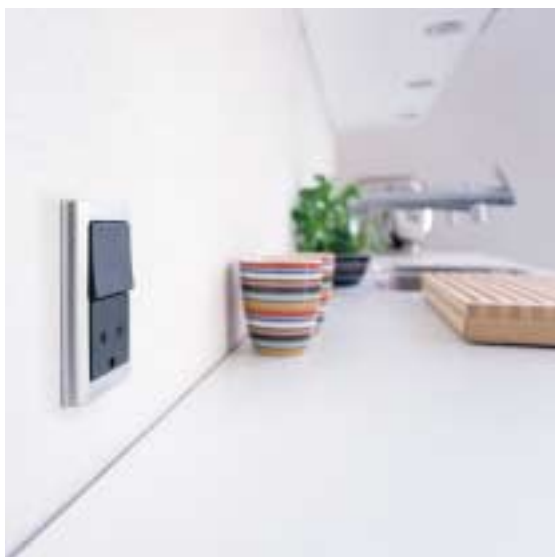
Efter – LK FUGA® afbryder i koks/stålmetallic med 63 mm Softline ramme.