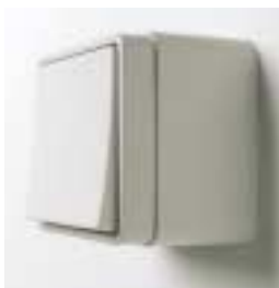
Afbryder monteret på underlag.