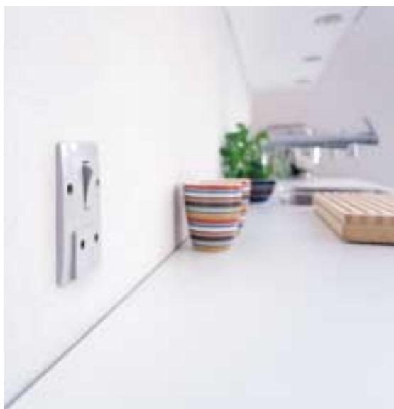
Før – gammel afbryder i grå.